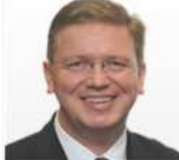
José Manuel Barroso a Štefan Füle

Stránky Evropské komise: http://ec.europa.eu