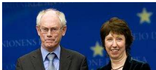
Herman Van Rompuy a Catherine Ashtonová

Nově je zřízena funkce předsedy Evropské rady. Dosud tuto funkci zastával vedoucí představitel státu předsedajícího Radě EU. Nyní je tato funkce stálá (volen je na 2,5 roku, maximálně pro 2 období). Předseda zasedáním Rady, vede její jednání a zajišťuje kontinuitu a zastupuje EU na nejvyšší úrovni na mezinárodní scéně. Od 1. prosince 2009 se stal tímto předsedou Belgičan Herman Van Rompuy.