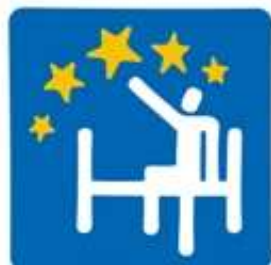
Europe for Patients

Koncem listopadu byli v Bruselu vyhlášeni tři vítězové druhého ročníku soutěže o cenu EU , udělovanou novinářům zabývajícím se oblastí zdraví .